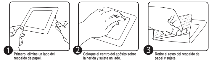
1 Primero, elimine un lado del respaldo de papel. 2 Coloque el centro del apósito sobre la herida y sujete un lado. 3 Retire el resto del respaldo de papel y sujete.